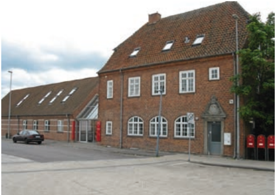
Posthuset i Tølløse

Bygningen blev gennemfotograferet og opmålt, og det er nok mere end der kan siges om mange andre: i øjeblikket falder den ene jernbanebygning efter den anden for nedrivningsfirmaers hammer. Pakhuset i Roskilde forsvandt i april, remisen i Ringsted faldt i maj. Privatbanernes stationer 'moderniseres', hvilket betyder at de gamle pakhuse og småbygninger forsvinder.