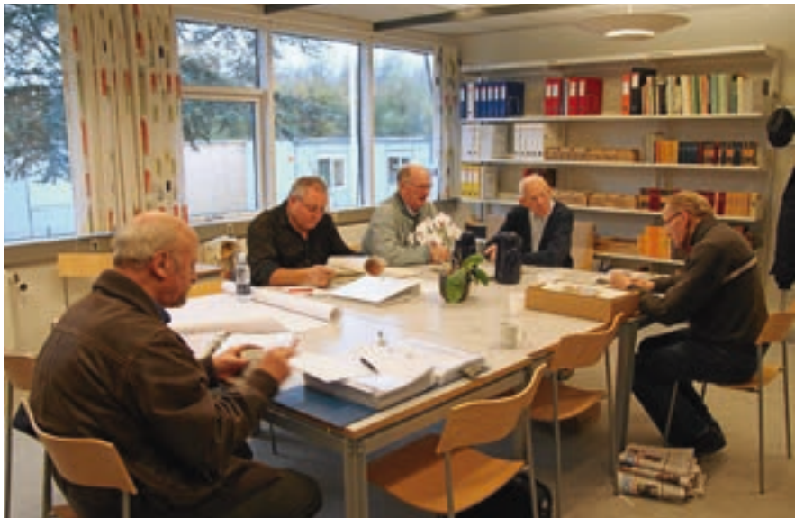
Åbningsdag i Tølløse Lokalarkiv 2010

Dette er imidlertid ikke den eneste ændring, året byder på for Tølløse Lokalarkiv. I marts 2007 flyttede vi fra kælderlokaler i det gamle kommunekontor på Hjortholm-