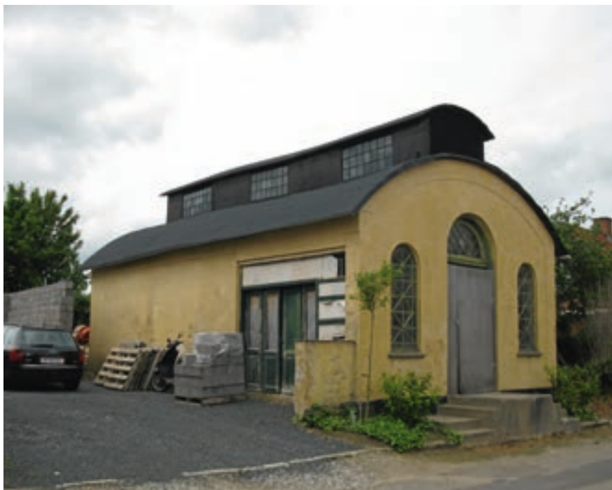
Elværket på Sofievej i Tølløse

get til Lokalhistorisk Forening, som indgik en aftale om, at der skulle udgives et hæfte om remisen. Heri ville man samle de oplysninger om bygningen, som foreningen havde samlet under sit virke.