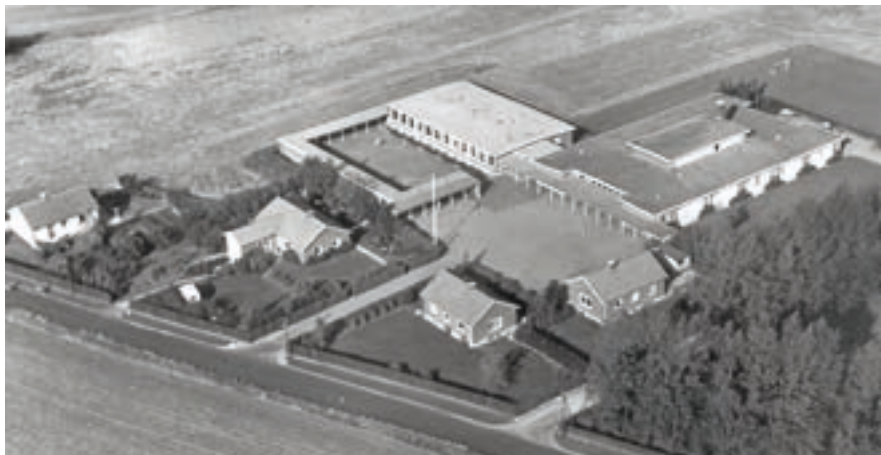
Stestrup Skole ca. 1965.

og moderne udstyr i det hele taget. Sammenholdes det med, at der i samme periode bygges tje- nesteboliger til lærerne, var resul- tatet, at skolen blev et centralt kul- turelt mødested i kommunen. Her