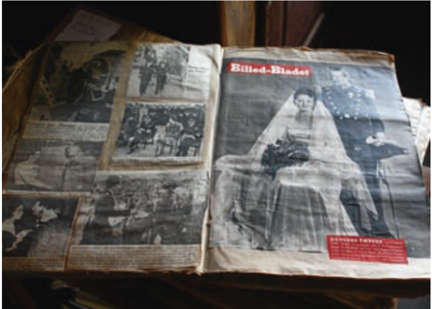
Én af de gamle scrapbøger