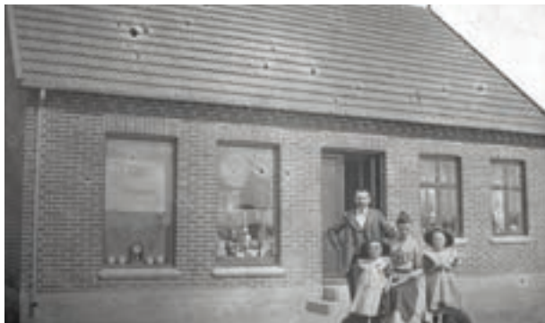
Huset på Borbergade, hvor der både var urmager og telefoncentral.

Det var også almindeligt, at man gav Centralen besked, hvis man tog på ferie. Så var der jo ikke nogen grund til at ringe op. Lige sådan var det, hvis man skulle til "kaffeslabberas". Så gav man også lige besked til Centralen.