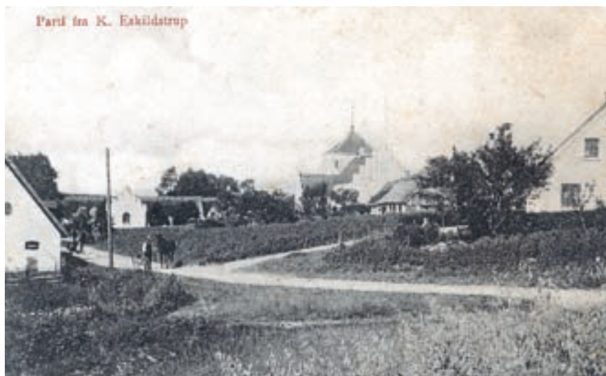
Omkring kirken i Kr. Eskilstrup (postkort, Tølløse Lokalkarkiv)

Anneksforholdet kom også til udtryk ved, at Annexgården, som ligger op til kirken, skulle stille et