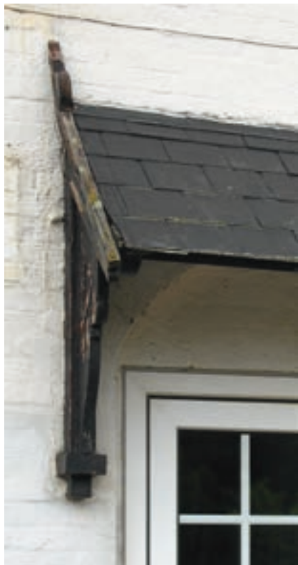
Nyt møder gammelt – Kr. Eskilstrup Station

En del af vores lokalhistorie er forankret i de bygninger, som vore bedsteforældre og oldeforældre lod opføre. Det er morsomt at vide, hvem der byggede ... var det Murer Frede, eller snarere murermester Olsen? Var der en arkitekt in-