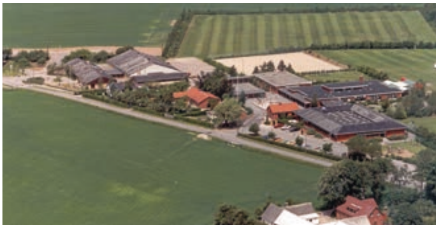
Stestrup Skole ca. 1978.

Kimen til næste bølge af industri- samfundets udvikling findes her.