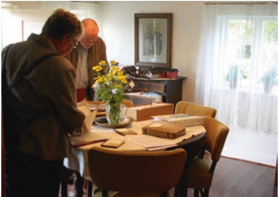
I stuerne på Hestebedgård