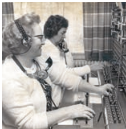
Kr. Eskilstrup Telefoncentral 1970

En telefonistinde skulle gå ind hver 3. minut for at høre, om der blev talt på nummeret. Det kunne abonnenten høre, så måske er det herfra, myten opstod om, at alle på Centralen vidste, hvad der skete i lokalsamfundet. Men som Jonna sagde: "En hemmelighed er kedelig, når man ikke må fortælle den til andre". Så hvorfor lytte?