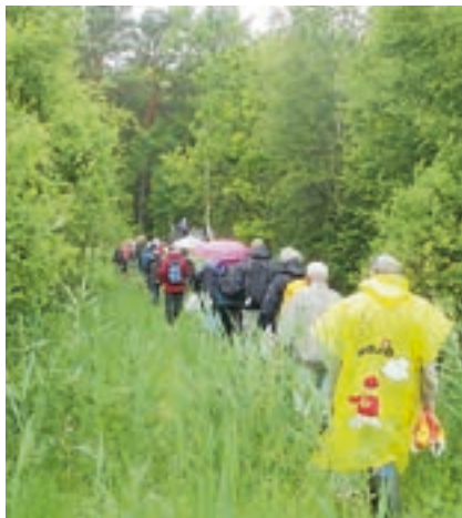
I gåsegang over tidligere tørvegrav