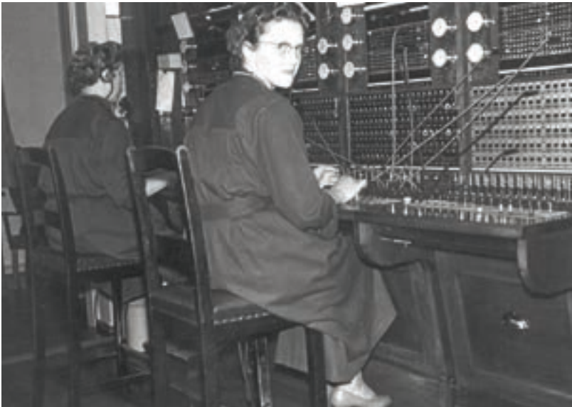
Telefonistinder på Tølløse Central i 1950'erne. Læs inde i bladet om, hvordan det var at være telefonistinde i Kr. Eskilstrup