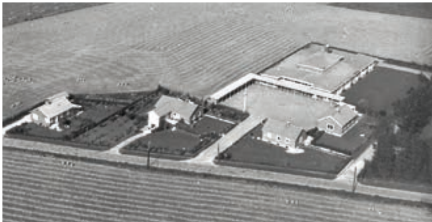
Stestrup Skole ca. 1958.

den med besked om, at man igen havde glemt "at slå knappen ned". Men efter et par års forløb fik skolen egen telefon.