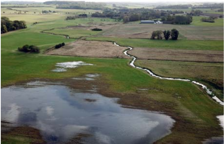
Det nye snoede åforløb. Foto: Michael Johansen / Ejlf Rude Jensen, 2019.

Vådområdet blev skabt ved at genslynge Elverdamsåen og Amtsskelrenden i midten af ådalen og åen blev derved forlænget med ca. 1 km. Dræn mm, der sikrede projektområdets afvanding ved pumpning, blev fjernet og pumpningen af området ophørte. Resultatet blev 27 ha. tør eng, 16 ha. våd eng og 29 ha. sump/vandmættet jord. Tempelkrog Syd er nu privatejet, og der er ingen adgang til området.