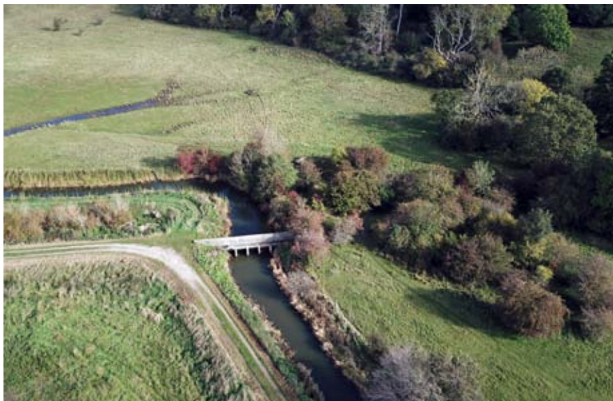
Slusen ved Asserholm-dæmningen. Foto: Michael Johansen / Ejlf Rude Jensen, 2019.