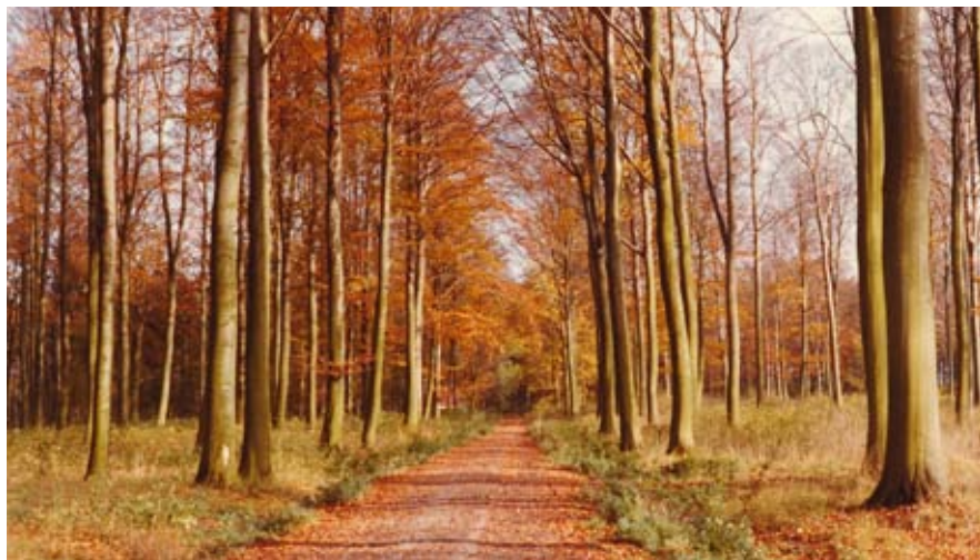
Sti i Nederskoven. Foto: Anker Hansen, udateret.

Her kørte posten tidligere med hestevogn og senere med bil. Takket være velvillighed fra de berørte lodsejere var det muligt at få denne trampesti oprettet. Efter at have fået de fornødne tilladelser fra lodsejerne, var det meningen,