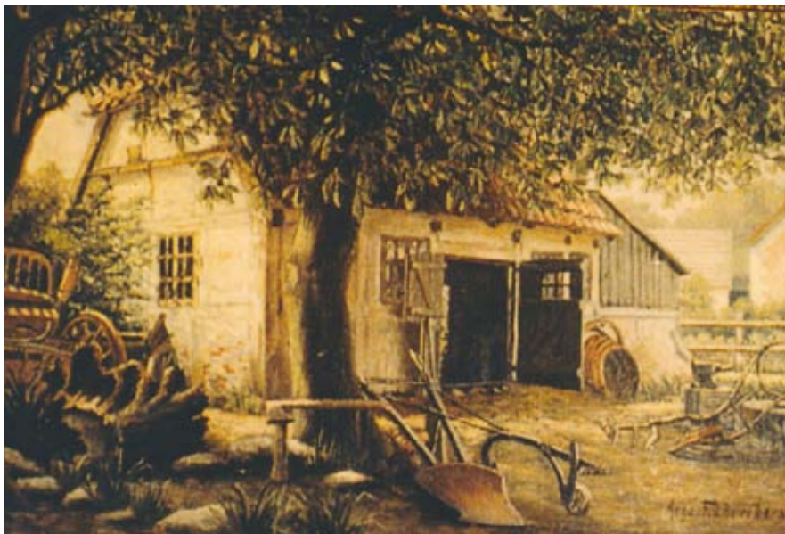
Ugerløse Smedje, malet af Aage Frederiksen. Det var smeden, der tilbage i tiden tog sig af sygdom hos dyrene.

get på en uddannelse som smed. Det var ikke de mindre husdyr, men først og fremmest heste, der skulle helbredes. Heste var det afgørende transportmiddel, ikke mindst til krigstjeneste. Hestesyn skulle derfor foretages af en eksamineret dyrlæge, som skulle indberette til herredsfogeden.