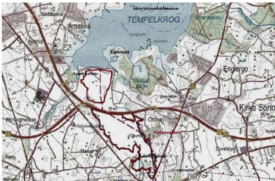
Kort over Tempelkrogen.

sel-istiden (den sidste istid). Smeltvandstrømmene fra dødisen frosede mod nord gennem en fordybning i landskabet og udgravede Elverdamsdalen. Der samlede sig en stor ferskvandssø uden udløb til havet. Orø var landfast. For ca. 7.000 år siden var havniveauet steget kraftigt, og i den sydlige del af hvad der skulle blive Isefjorden stod vandet 3 meter højere end nu. Dalbunden blev dækket af havet og der blev aflejret sand, som dannede den flade dalbund nord for Aastrup. På kort fra de nyeste undersøgelser af havstigninger mellem 6000 og 5000 f.Kr. ses Tempelkrogen og Holbæk Fjord. Isefjorden er åben til Kattegat, og