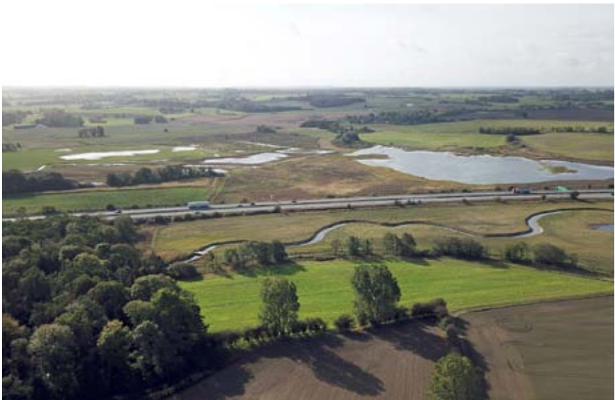
Tempelkrog Syd set hen over motorvejen.