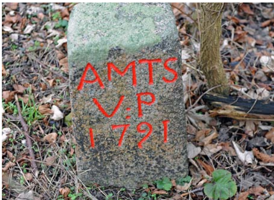
Amtsvejpligtstenen fra 1791 ved Elverdamsmøllen.

at hente vand til Elverdamsmøllen. Selve åen rørte man imidlertid ikke meget ved. Den var herreds- og amtsskel. På et kort fra 1823 har åen fortsat sit naturlige forløb gennem engene hen til Tempelkrogen. På kort fra 1859 er den udrettet langs Aastrups Dyrehave og op til landevejen. I 1894 er dalbunden gennemskåret af drænggrøfter, men åen løber stadigvæk i midten af dalbunden. Engene blev brugt til græsning og høslet. Selve Tempelkrogen blev brugt til fiskeri og jagt, herunder jagt på marsvin, som fortsatte til langt hen i 1900-tallet.