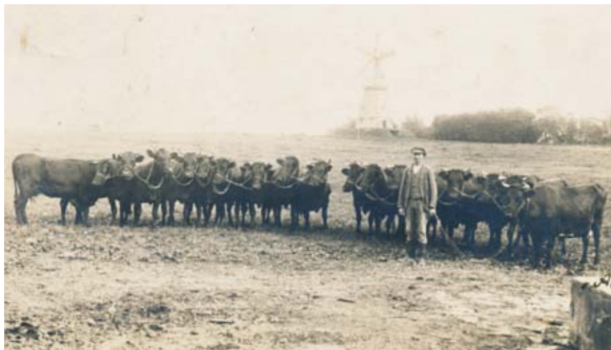
Mand med et koppel køer ved Merløse Mølle. Datering: 1915.