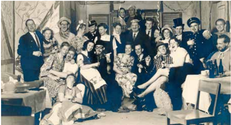
Aktørerne ved Tenniskabaretten på Tølløse Hotel.