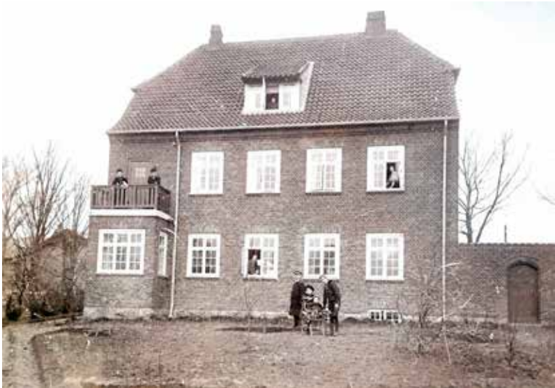
Tølløse Postkontor set fra haven ca. 1915.