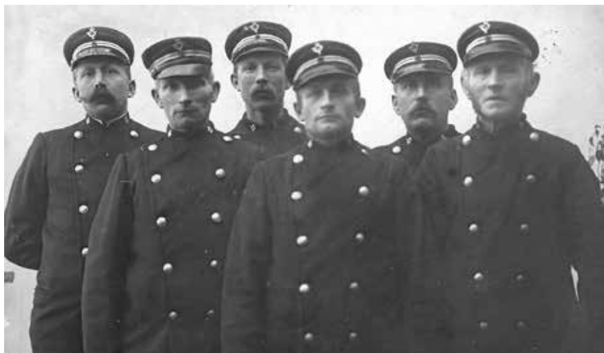
6 landpostbude ved Tølløse Postkontor. Datering: 1915-16.