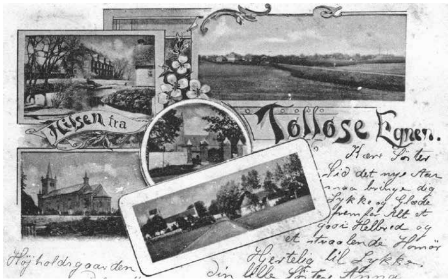
Lokalt postkort fra før 1905.

tion, mens post og pakker blev befordret i postvogne og postbiler. I 1916 udgik personbefordring fra postvæsenets opgaver. I 1927 oprettedes det P&T , som vi alle har kendt.