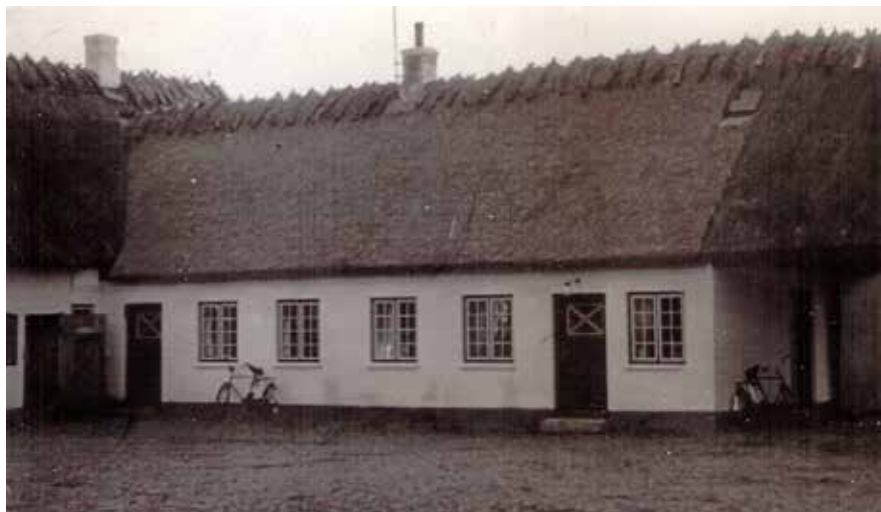
Det nye stuehus. Datering: efter 1932.

veværelse, det samme med det tilstødende børneværelse. Så det kunne være en barsk omgang at komme i seng om vinteren, navnlig i de meget kolde vintre under krigen. Men så blev sengen som regel forvarmet lidt med en varmedunk eller en varm sten. Dynerne var tykke og varme, så det gik, når man først havde fået sengen varmet op. Men der kunne godt være rim på dynen, når man vågnede om morgenen. I øvrigt var børneværelset meget lille og kunne kun lige rumme de 3 børnesenge.