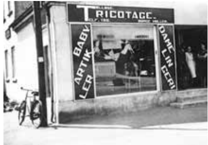
Trikotage- og skotøjsforretning på Jernbanevej 18 C. Udateret.