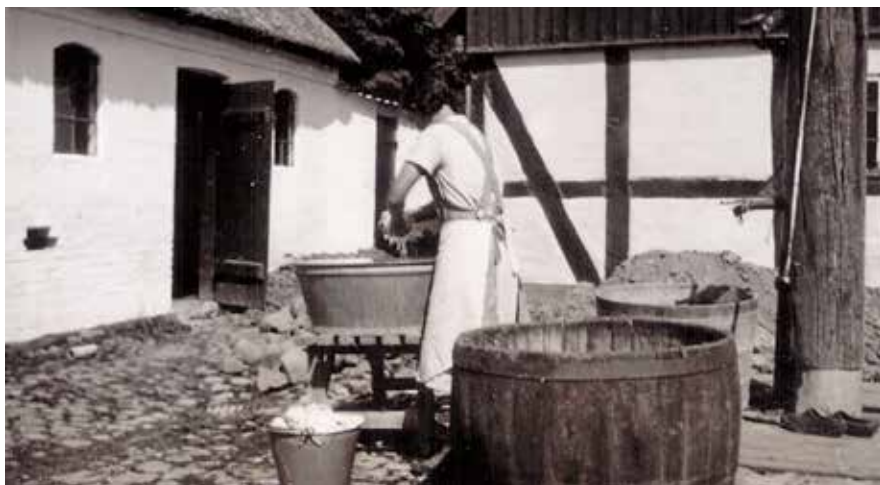
Storvask ved brønden. Udateret.