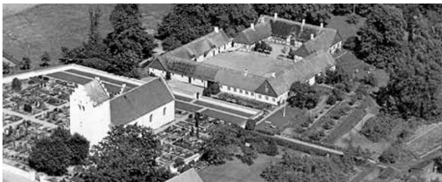
Luftfoto af St. Tåstrup Kirke og – Præstegård, med forpagterboligen i længen nærmest kirken.

I St. Tåstrup Præstegård boede præsten og forpagteren tæt på hinanden og havde fælles gårdsplads. Det krævede derfor et godt samarbejde at få det til at glide uden for store uoverensstemmelser. Det gik godt det meste af tiden. Indimellem kunne der dog opstå gnidninger, men da far var en rolig og besindig mand, som ikke var let at blive uvenner med, blev problemerne løst.