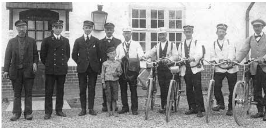
4 postbude i sommeruniformer på St. Merløse Station. Udateret.