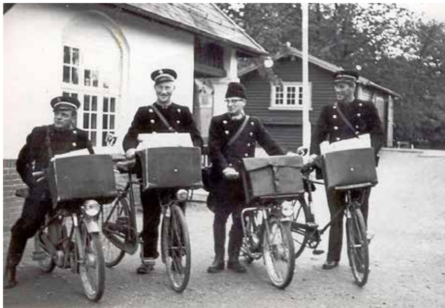
Postbude med deres tjenestecykler i St. Merløse. Udateret.

Efterhånden blev cyklen afløst af biler på de længste ruter. I 1964 fik landposten en Renault 24. For Tølløse blev der i 1970 oprettet to motoriserede ruter (Tølløse-Marup og Tølløse-Vallenderød), én landroute, som blev betjent på knallert, og to