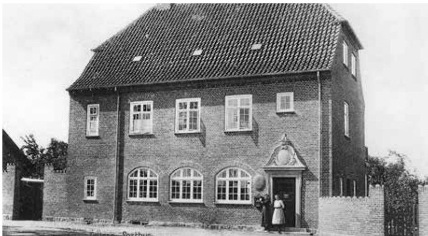
Tølløse Posthus på Jernbanevej 20. Datering: 1911.

nen. Alle kendte dem, og de kendte alle. De kom ud til de fjernest liggende gårde og husmandssteder. De gav en hånd med, når der var brug for lidt hjælp og fodrede hunden, hvis dens herre var væk. Når landposten kom, blev der holdt pause, lavet kaffe og udvekslet nyheder fra sognet. Som en landpost sagde: 'Jeg kendte 130 køkkener'