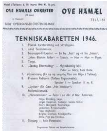
Program fra Tenniskabaretten 1946.