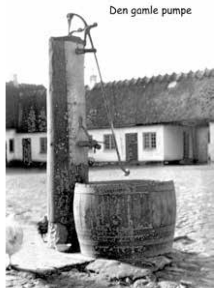
Pumpen på gårdspladsen. Udateret.