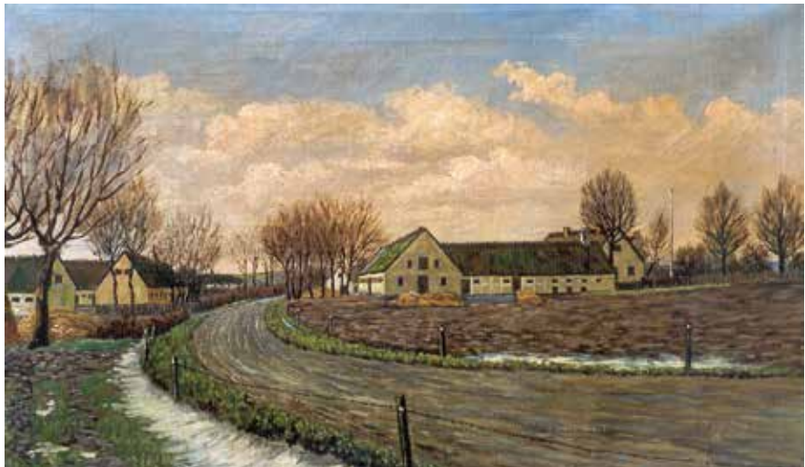
Nyrup set fra øst. Maleri af Aage Frederiksen, 1951