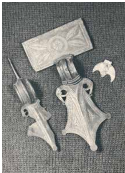
2 sølv- og 1 guldhængesmykke fra ældre germansk jernalder, fundet ved Kvarmløse i 1891.

Kvarmløses overdrev strakte helt til Marup, dvs. nordpå langs med Elverdamsdalen. Kvarmløse blev ikke kirkeby, men kom til at henhøre under det nærliggende Soderup. Den jord, som Tølløse Stationsby blev bygget på, henhørte under Kvarmløse by, som det fortsat fremgår af vore matrikelkort. Bygdens grænse har formodentlig gået tværs gennem, hvad der nu er Tølløse, hvor undergrunden endnu er præget af underjordiske vandårer, moser og en nu næsten forsvundet dal, som der endnu kan ses spor af ved Sejergårdsskolen. Ved Kvarmløse ligger resterne af et middelaldervoldsted, som måske har været forløberen for den senere Aastrup Hovedgård. Det ældste Aastrup – torpen på åsene 12 – har ligget højt oppe med udsigt over dalen. Ingen storbonde ved sine fulde fem ville have bygget en gård i den sump, hvor klostret ligger nu. Aastrup har været en typisk græs-