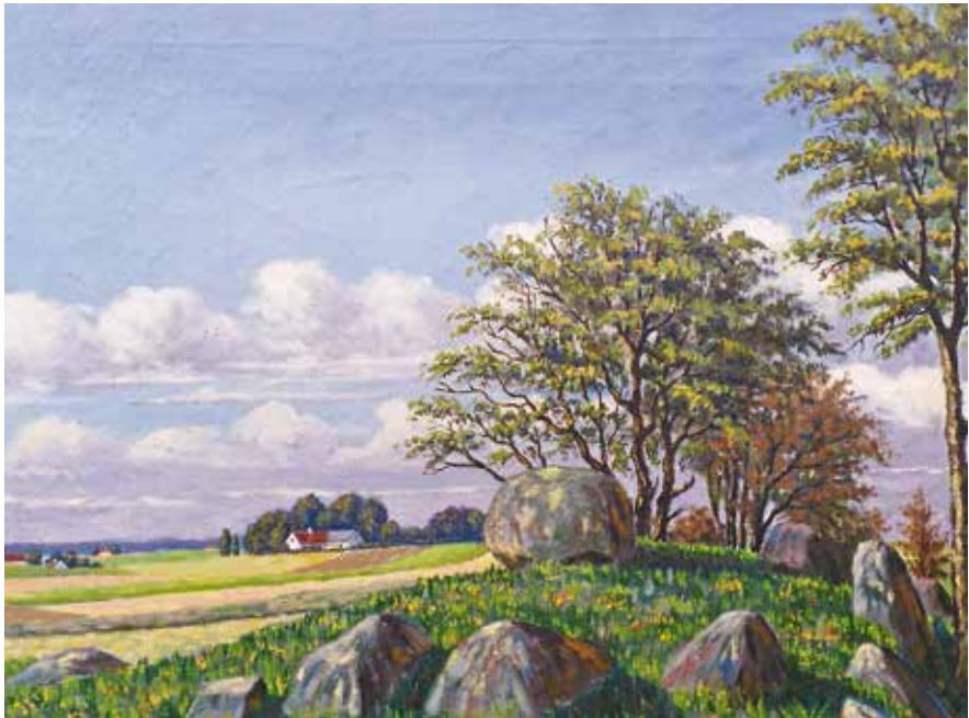
Ukendt stendysse, malet af Aage Frederiksen (udateret)

Der har levet mennesker i Merløse herred og naboherrederne helt tilbage i den tidligste Jægerstenalder. De ældste fund stammer fra Åmosen (spredte fund af redskaber og spor af hytter) og fra kysten ved Isefjorden (Ertebøllernes køkkenmøddinger). De første bønder