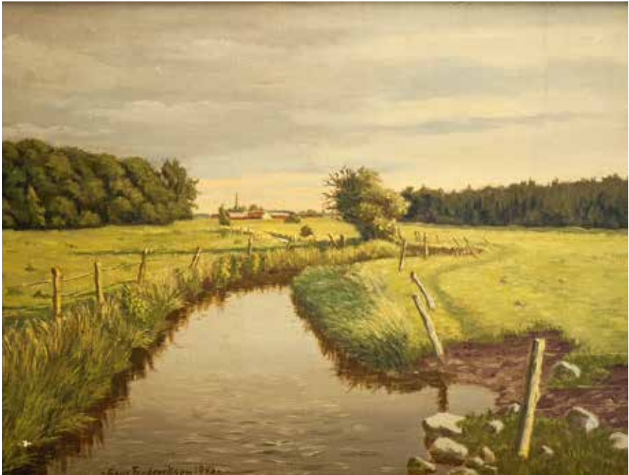
Jonstrup Å med Vanløse Teglværk i baggrunden, malet af Aage Frederiksen, 1946

antyder, at det var et tørt område 'uden vand'. Efter reformationen kom sognet til at høre under Alsted herred.