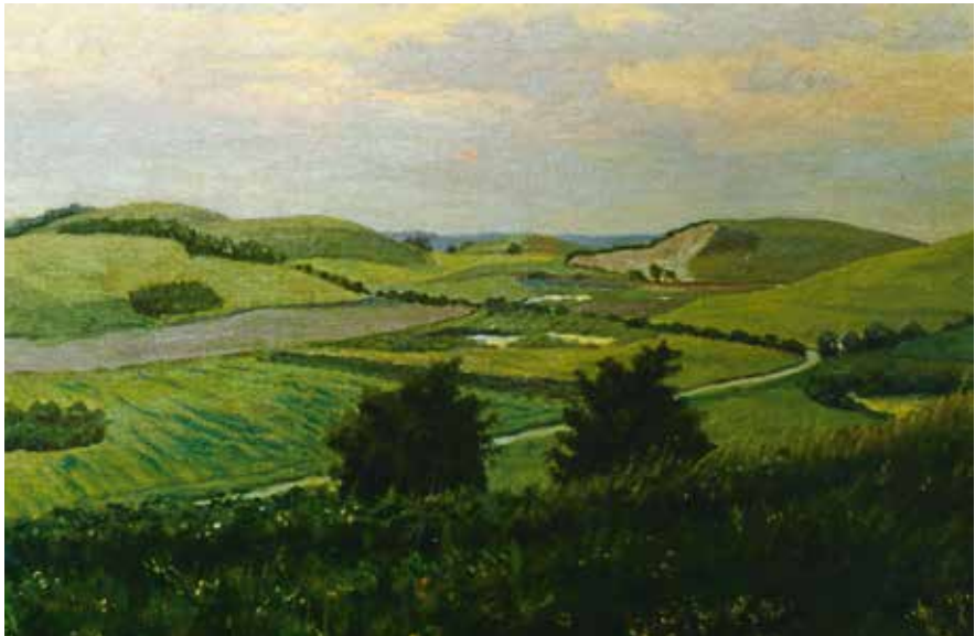
Gallo (Kvanløse sogn) med grusgraven i baggrunden, malet af Aage Frederiksen, 1951

kan bruges til forskellige formål. Strandkvan vokser også på fugtige steder inde i landet og ved åer. Skovangelik vokser fortrinsvis på fugtig lermuldet jord, og det har der været rigeligt af på Kvanløseegnen med de mange dødishuller. Andre sprogforskere foretrækker et glde *kvand = tændeved, optændingsbrænde som forled. I så fald kan der være tale om en bavneshøj – måske på Mørkemosebjerget, som er det højeste punkt i området. Det er dog tvivlsomt, om systemet med bavneshøje går så langt tilbage.