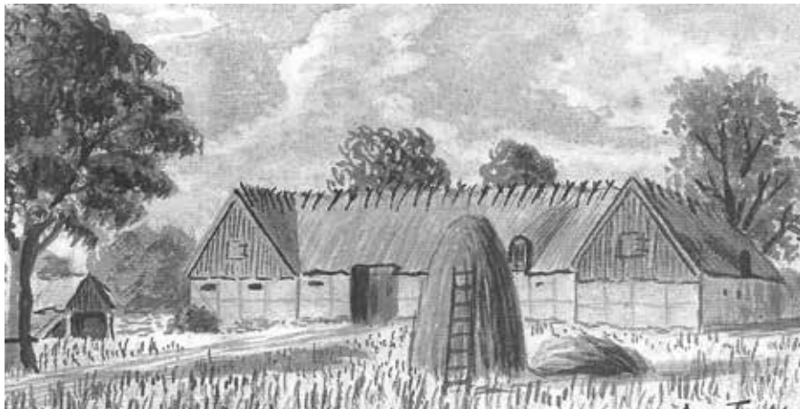
Tjørnholm, Østrupvej 118 i Ugerløse, tegnet af Aage Frederiksen i 1926

terræn ved den østlige del af Åmosen og Åmose Å. Forleddet kan henvise til vandløbet eller vandfladen i nærheden: gl. *und – bølge. I middelalderen hørte Undløse under Tuse herred. Hovedgården var Kongsdal, som ejedes af den jyske del af Hvideslægten, og som senere fik navnet Tygestrup.