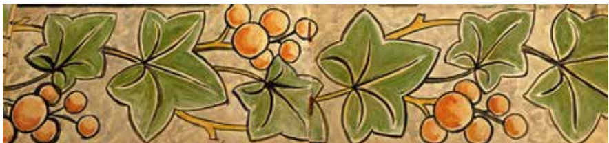
Fra Aage Frederiksens skitsebog

Fra læretiden eller opholdet i Aarhus stammer en fin skitsebog, hvor man kan finde forlæg til forskellige dekorationsbortter i skønvirkestil. Skønvirkestilen udviklede sig i Danmark ud fra den franske Art Nouveau, den tyske Jugendstil og den engelske Arts and Crafts-bevægelse. Dens storhedstid ligger i de første årtier af 1900-tallet og falder til dels sammen med nationalromantikken og derved også ved Aage Frederiksens læretid. I skitsebogen er der tale om meget omhyggelige og delvis farvelagte tegninger, som kunder har kunnet se på og vælge fra. Man kan spør-