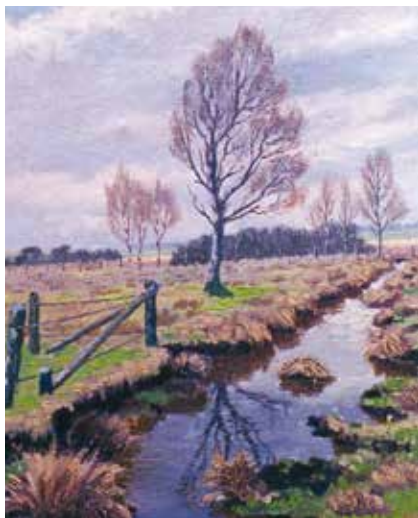
Parti fra Lyngen ved Ugerløse, malet af Aage Frederiksen (udateret)

På Sjælland er der indtil dato kun gjort få bopladsfund, men de enestående rige grave fra Himlingøje og Stevns vidner om nære kontakter sydpå til Tyskland og videre til Romerriget. Et aristokrati af rigmænd med familiebånd langt inde i landet begyndte at manifestere sig. 9 Øverst i hierarkiet i et samfund med hovedrige høvdinge og hirdmænd 10 , som vi senere kender det navnlig fra runeindskrifterne, står en uproduktiv gruppe mænd, som fortærer bøndernes produktionsoverskud.