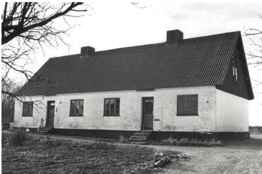
Det tidligere fattighus i St. Tåstrup, Tåstrupvej 69

Han står i lang tid og venter og hører af og til knas fra skoven, men ikke noget han kan tage sigte på. "Nu må der dog snart ske noget!" tænker han, og i det samme letter en fasan langt ude og forsvinder af syne bag krattet ved gærdet. Han bliver mere og mere irriteret og tænker på, om Hans Nielsen