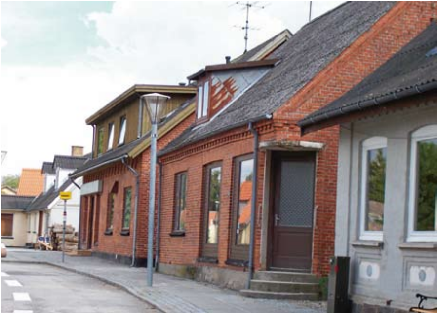
Bygaden med tomme butikslokaler, 2006

der blev bygget en ny forretning på Ørnevej, som i dag er den eneste dagligvarebutik i byen.