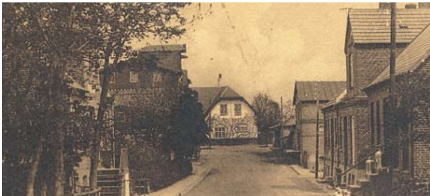
Tværvæg set mod Merløse Station