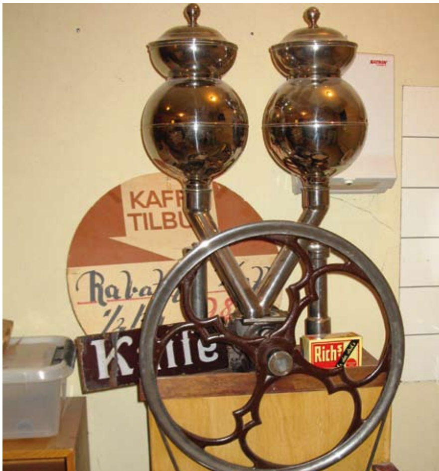
Kaffe-Karens kaffemølle

femølle hjemløs. I arkivets nye lokale var der ikke plads, og den hørte heller ikke hjemme i biblioteket. Så den meget tunge mølle