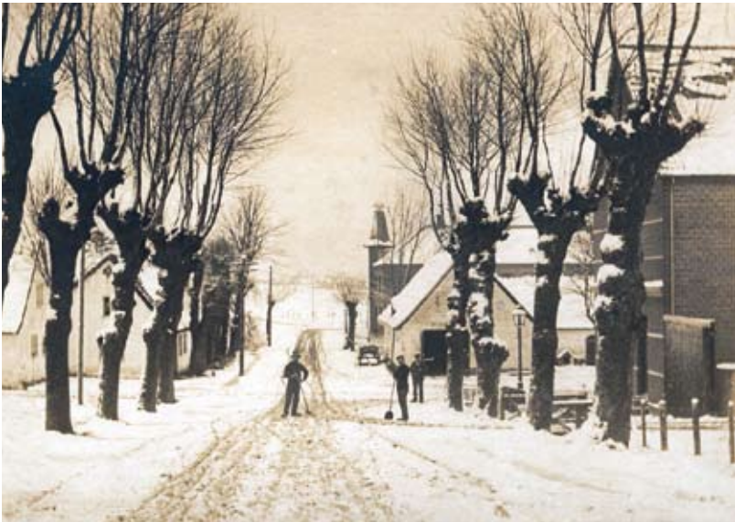
St. Merløse ved vintertide. Læs fortsættelsen af sognehistorien inde i bladet