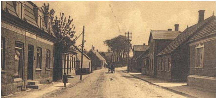
Parti fra Bygaden (postkort Tølløse Lokalkiv)