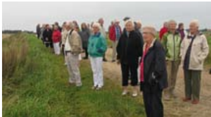
Et udsnit af deltagerne på turen

D. 10. september 2011 fandt foreningens efterårsudflugt sted. Målet for de 72 deltagere, der fordelte sig i 2 busser, var denne gang Sønderjylland, og guide på turen var foreningens næstformand, John Jeppesen. Første stop var Urnehoved Tingsted, der indtil 1523 var landsting, og som især i nyere tid har været et folkeligt samlingssted. Herefter passeredes den dansk / tyske grænse, som der blev kørt parallelt med mod Vadehavet. Ved Norddiget kunne man se grænsepælen, der markerer Danmarks vestligste grænse. Aftensmaden blev indtaget på Ager-skov Kro, hvorefter kursen blev sat mod Rømø, hvor man skulle se "Sort sol". Men desværre havde stærene denne dag ikke lyst til at flyve i formation netop dette sted, sikkert fordi en stor traktor med wrap-maskine kørte larmende på diget. I det fjerne syd for dæmningen kunne man ane naturfænomenet, men helt tæt på kom deltagerne ikke. Alligevel var det en rigtig vellykket tur.