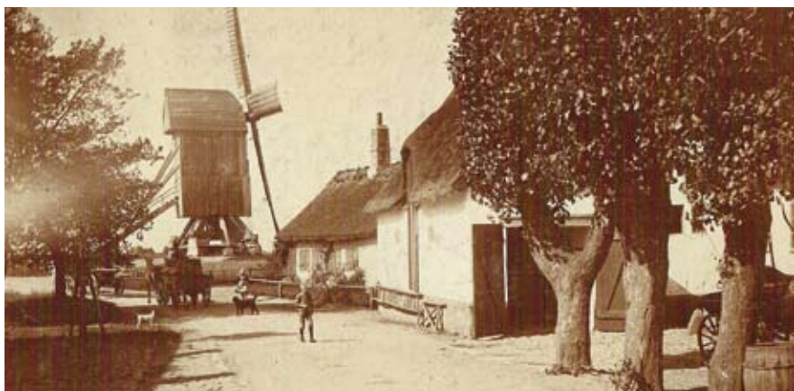
Stubmøllen i Gl. Tølløse set fra Møllegårdsvej (Tølløse Lokalkarkiv)